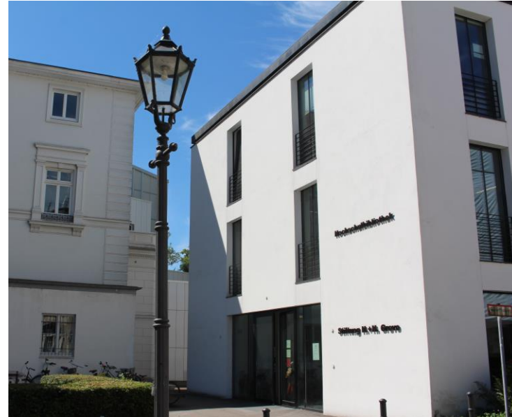
Standort im Campus Barmbek (Open Library)